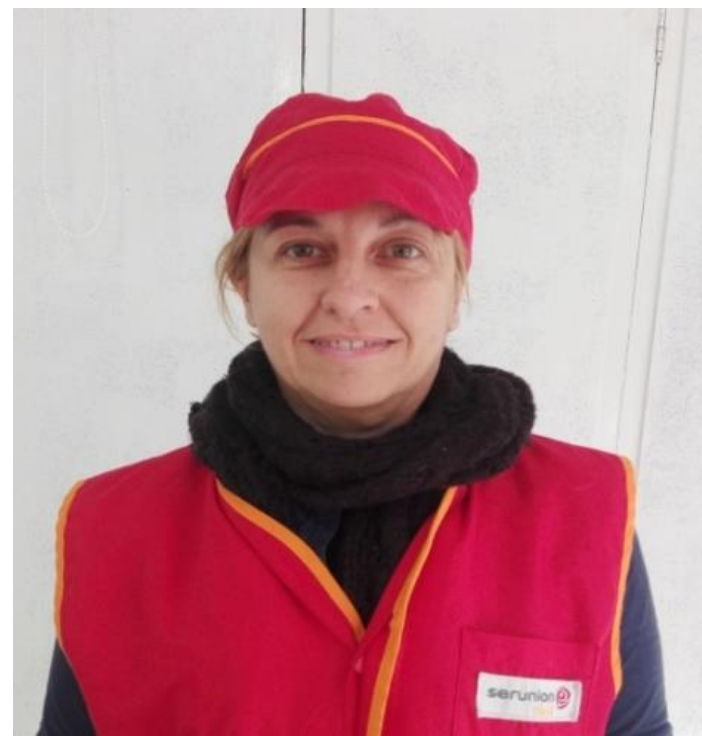
📍 Teia, 1r B