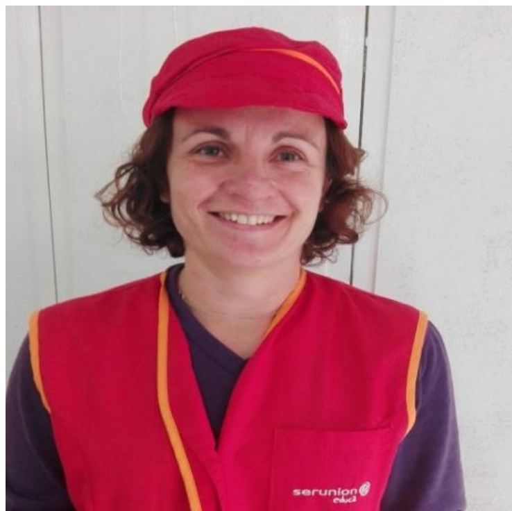
📍 Cati, 1r A i 3r