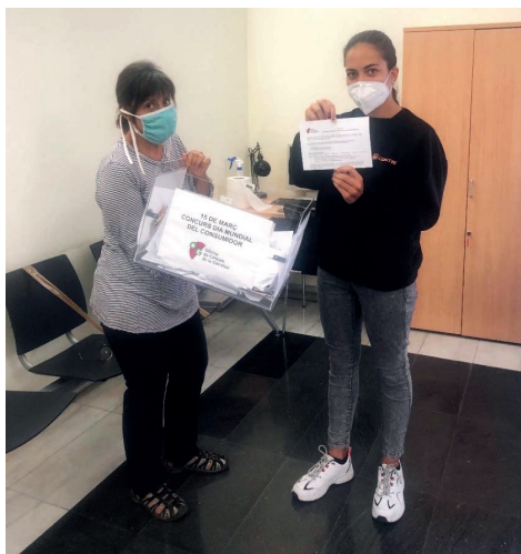
* Foto guanyadora del concurs del dia mundial del consumidor.

Durant l'any 2020, l'Oficina de Consum de la Garrotxa ha dut accions de millora amb el Club Natació Olot, Funerària Besora, Sorea i Clínica Dental Dentix Olot.